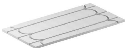
Plaque de sol fermacell® Therm25™